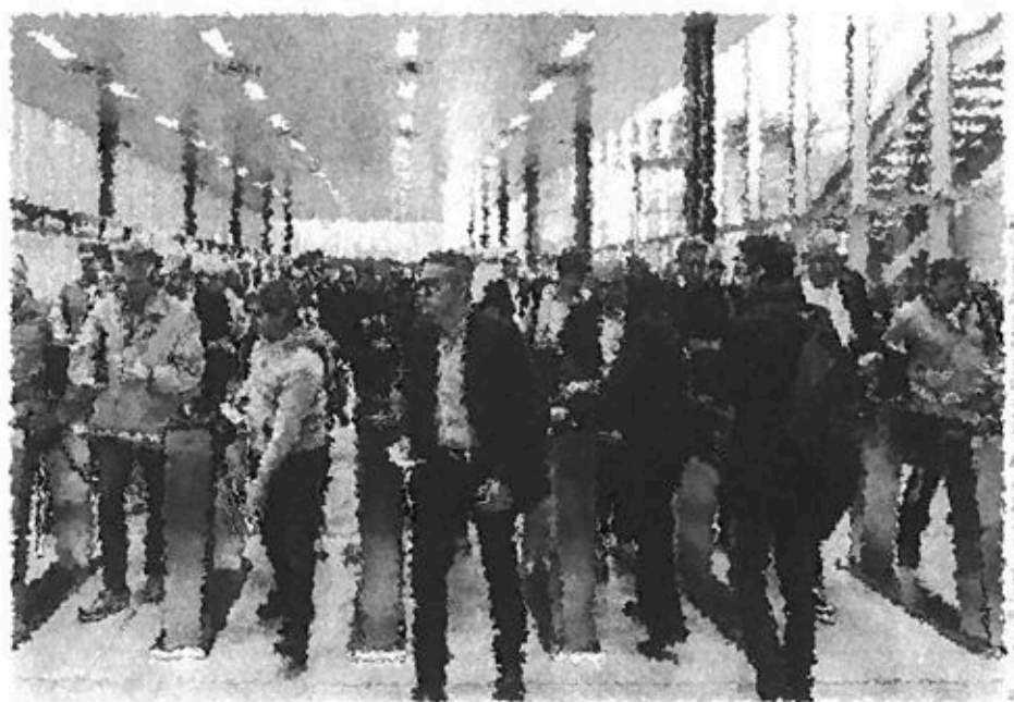
Salon UNIMET - Bergamo - Bergamo - Bergamo